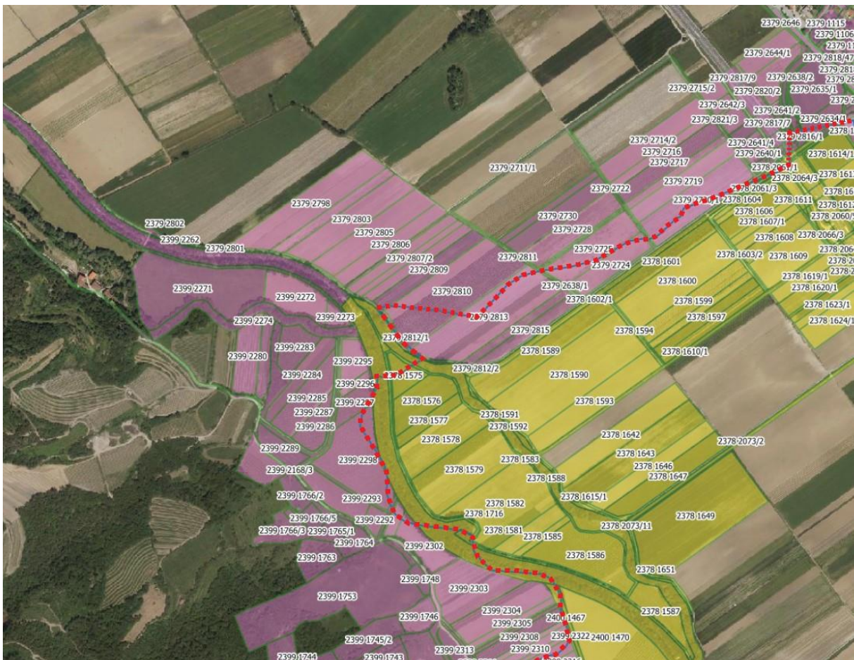
Priloga 1 – Trenutno stanje

Obstoječi podatki o mejah občin v registru prostorskih enot niso usklajeni s tistimi v zemljiškem katastru ( Priloga 1 ).