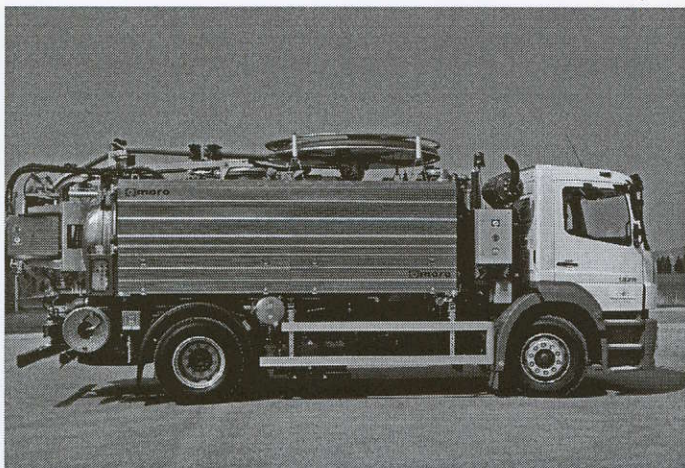
Vozilo za čiščenje kanalizacije in praznjenje greznic

Direktor: | Evstahij Paljk, univ.dipl.ekon.