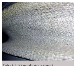
Tekstil, ki vsebuje azbest

vinaz plošče, linoleji z azbestnimi vlakni