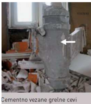
Cementno vezane grelne cevi