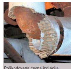
Poškodovana cevna izolacija