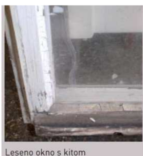
Leseno okno s kitom