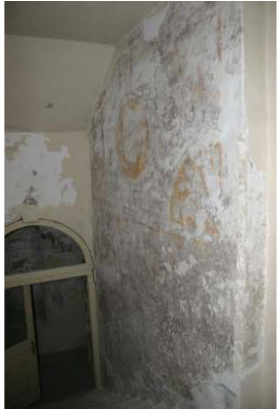
Slika 23: poslikava na S steni stopnišča in iz nadstropja na podstrežje

Odkrite so bile vse površine, kjer so poslikave predvidene.