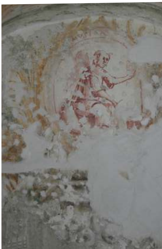
Slika 11: detajl poslikave na S steni pr/12