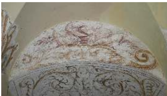
Slika 12: poslikava na S steni in vratnem ostenju pr/13