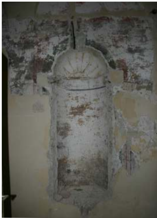
Slika 22: odkrita niša na Z steni n/12