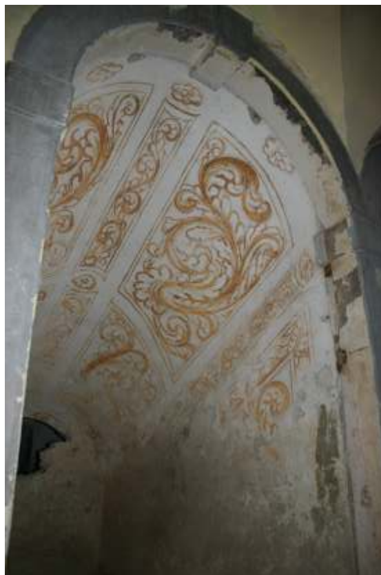
Slika 15: poslikava na j steni in stropu stopniš a iz pritli ja v klet

Odkrite so bile vse površine, kjer so poslikave predvidene. Odkrivanje je v tem prostoru končano.