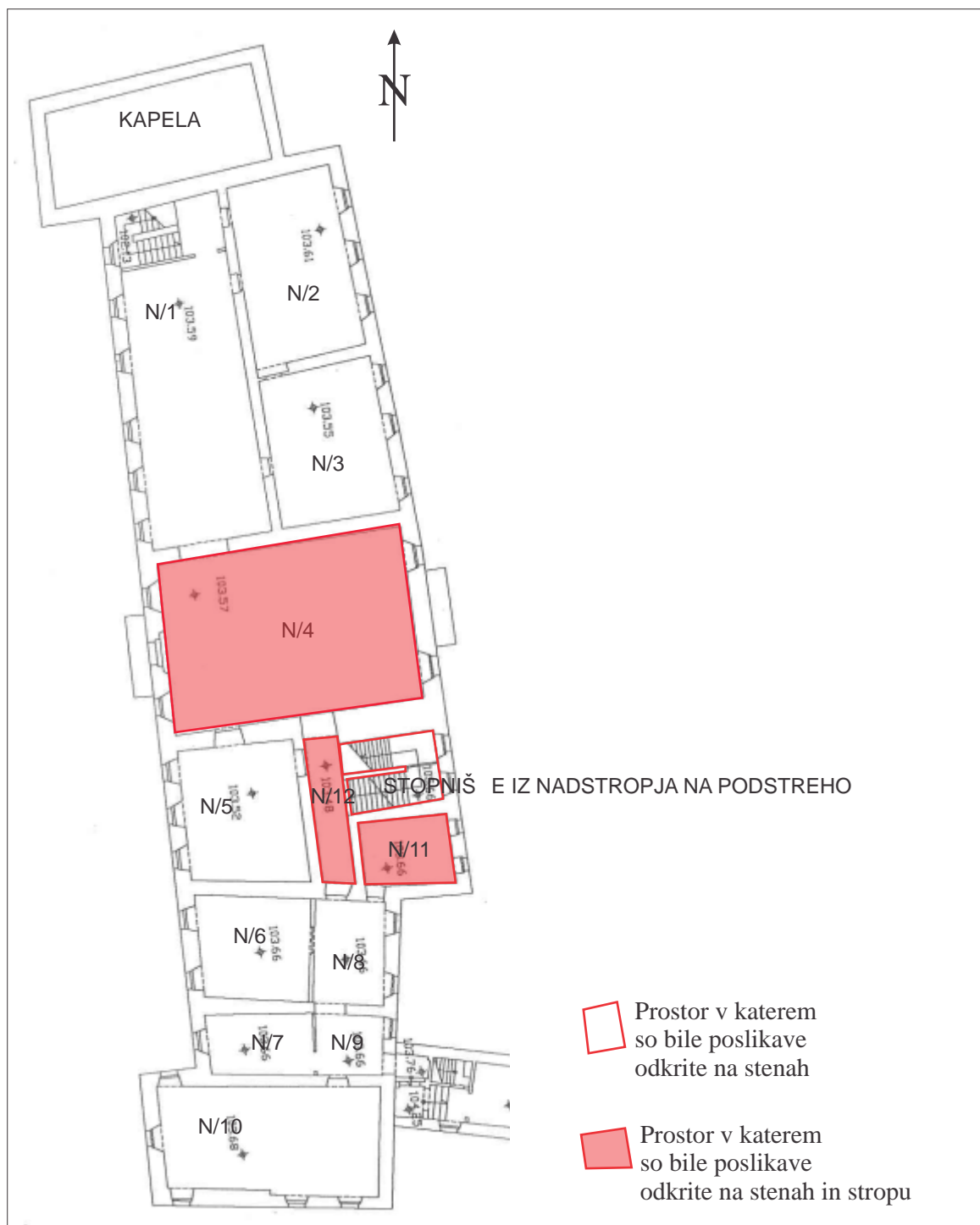
Slika 19: Grafi ni prikaz površin v nadstropju, za katere je sondiranje pokazalo, da so bile poslikane in ozna itev prostorov