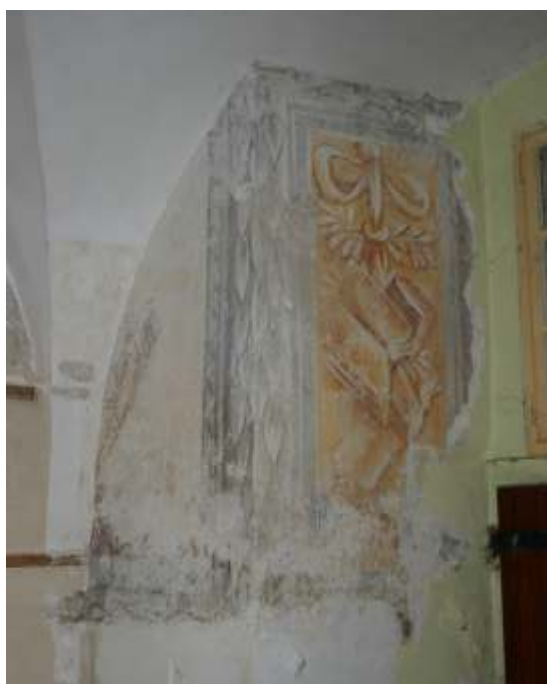
Slika 9: poslikava na Z steni pr/7