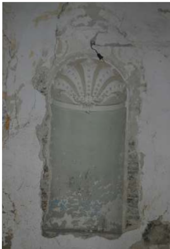
Slika 14: niša s štukaturnim okrasjem na j steni kapele