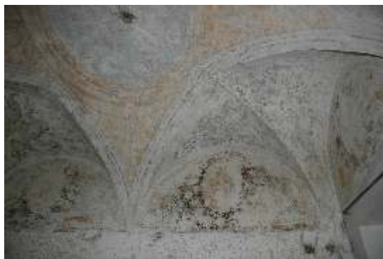
Slika 20: poslikava na S steni in stropu n/11

Odkrite so bile vse stenske površine, kjer so poslikave predvidene. Odkrivanje je potrebno še na stropu.