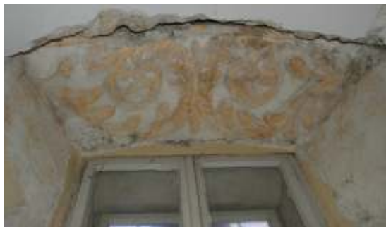
Slika 2: poslikava okenskega ostenja v pr/1

Ker je sondiranje pokazalo, da je bil prostor v preteklosti celovito obnovljen in so bili ometi verjetno v celoti izdelani na novo, v tem prostoru nismo izvajali posegov.