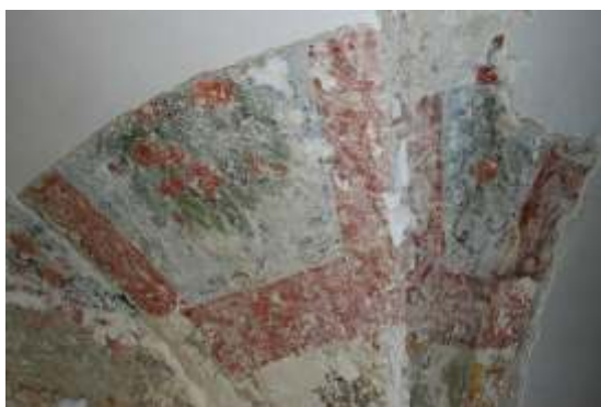
Slika 5: poslikava na stropu pr/4b