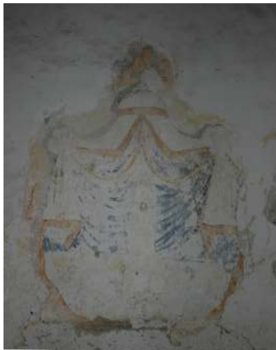
Slika 13: poslikava na j steni kapele

Odkrite so bile vse površine, kjer so poslikave predvidene. Odkrivanje je v tem prostoru končano.