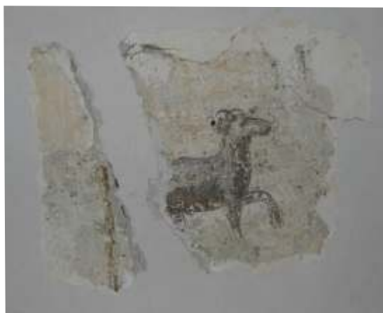
Slika 8: poslikava na stropu pr/7