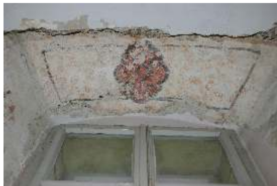
Slika 3: poslikava okenskega ostenja v pr/2