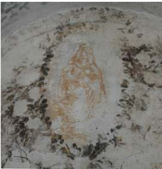
Slika 21: detajl poslikave na S steni n/11