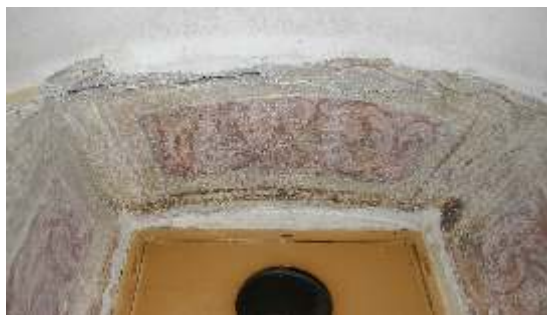
Slika 7: poslikava okenskega ostenja pr/6

Ob sondiranju se je pokazalo, da so bile stene obzidane s plastjo votle opeke, zato bo potrebno prostor še enkrat pregledati po odstranitvi recentne prezidave. Zaenkrat v tem prostoru nismo odkrivali..