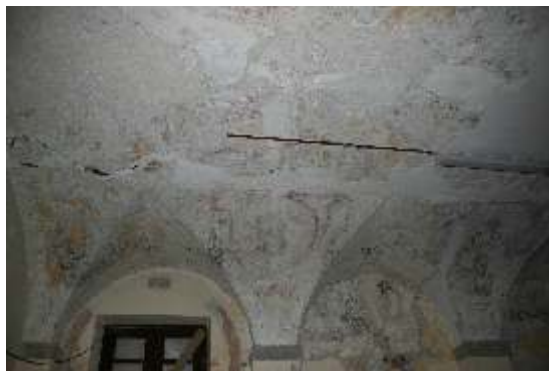
Slika 4: odkrite poslikave v pr/4a

Odkrite so bile vse stenske površine, kjer so poslikave predvidene. Odkrivanje je potrebno še na stropnih površinah.