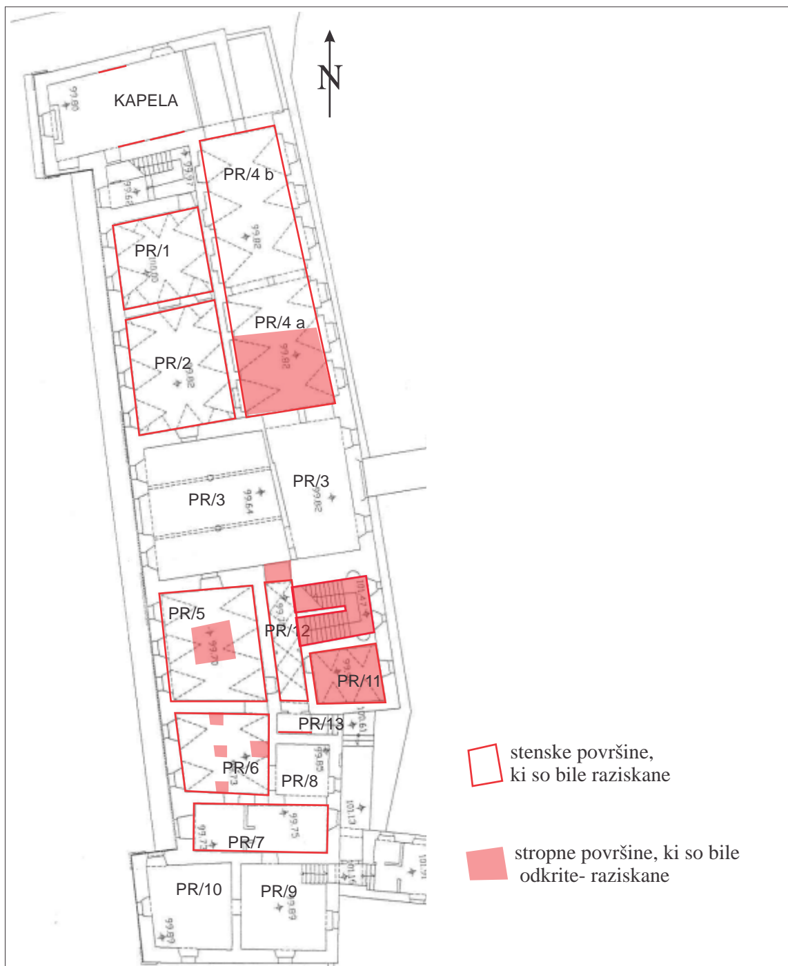
Slika 18: Grafi ni prikaz površin v pritli ju, ki so bile raziskane- odkrite