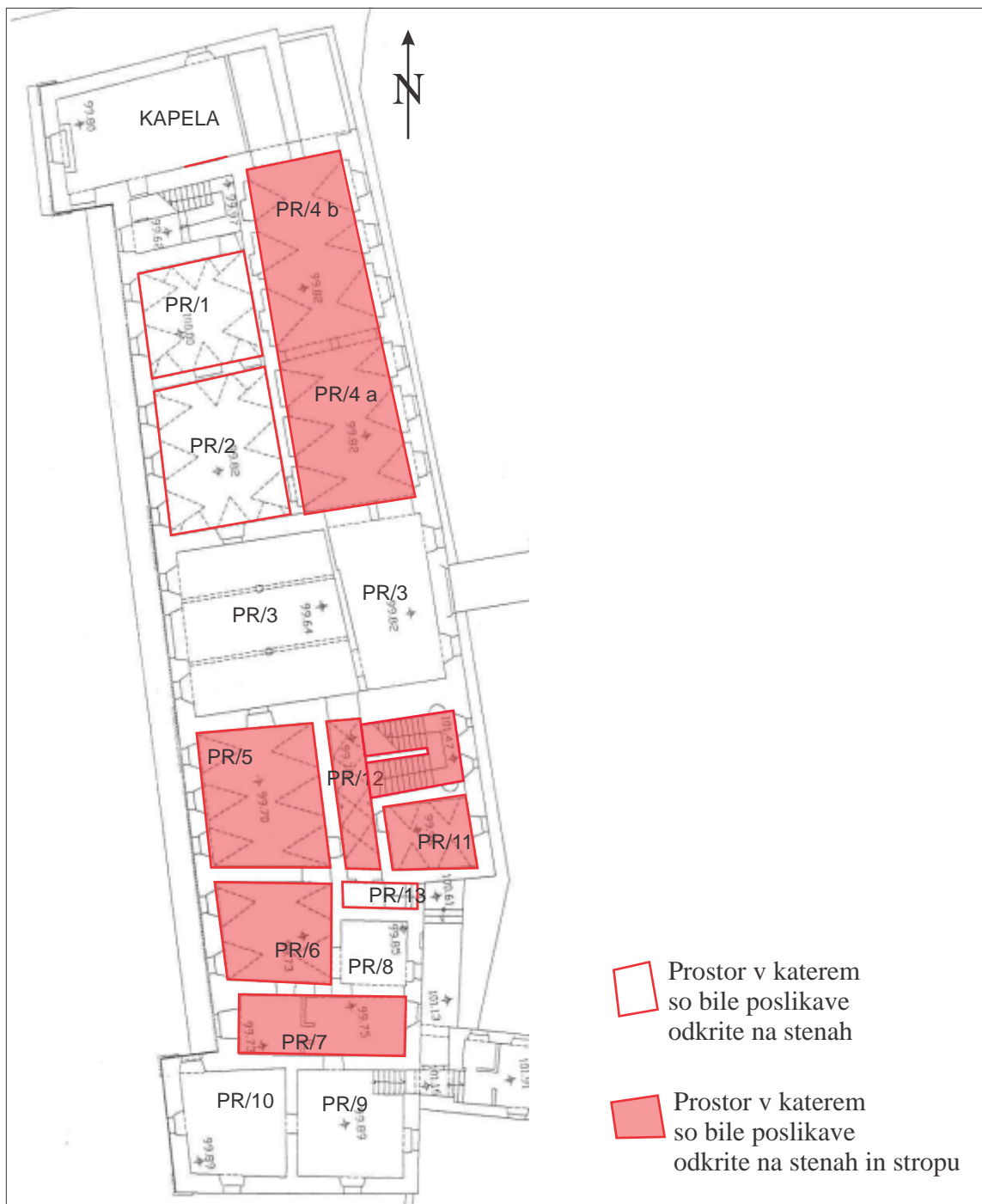
Slika 1: Grafi ni prikaz površin v pritli ju, za katere je sondiranje pokazalo, da so bile poslikane in poimenovanje prostorov