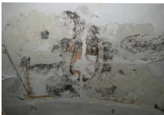
Slika 6: poslikava na stropu pr/5, verjetno orel, ki drži grb