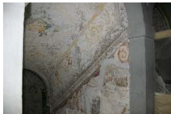
Slika 16: poslikava na j steni in stropu stopniš a iz pritli ja v nadstropje