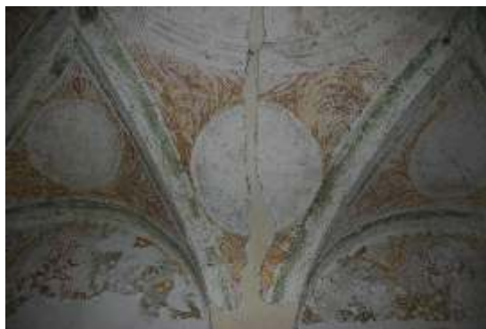
Slika 10: poslikava na stropu in S steni pr/11

Odkrivanje je bilo omejeno na stenske površine v zgornjem delu, ker so v spodnjem delu ometi že bili zamenjani in poslikave predvidoma uničene. Strop, ki je tudi poslikan, ni bil še odkrit. V lunetah pod stropom so poslikave dokaj solidno ohranjene in berljive. Verjetno gre za bojne motive.