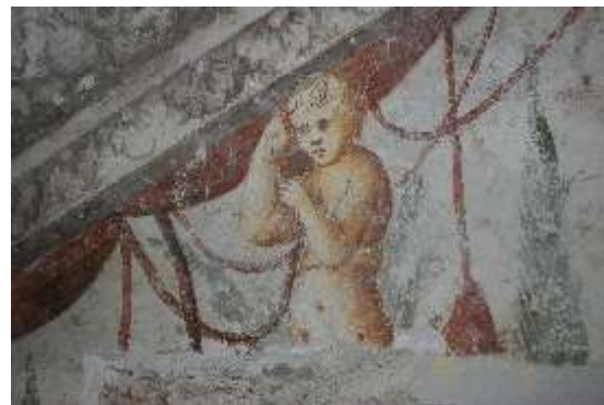
Slika 17: detajl poslikav na j steni stopniš a iz pritli ja v nadstropje